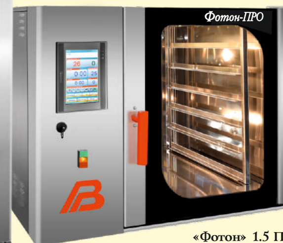
«Фотон» 1.5 ПРО

АО НПП фирма «Восход» производитель современного профессионального оборудования для хлебопечения.