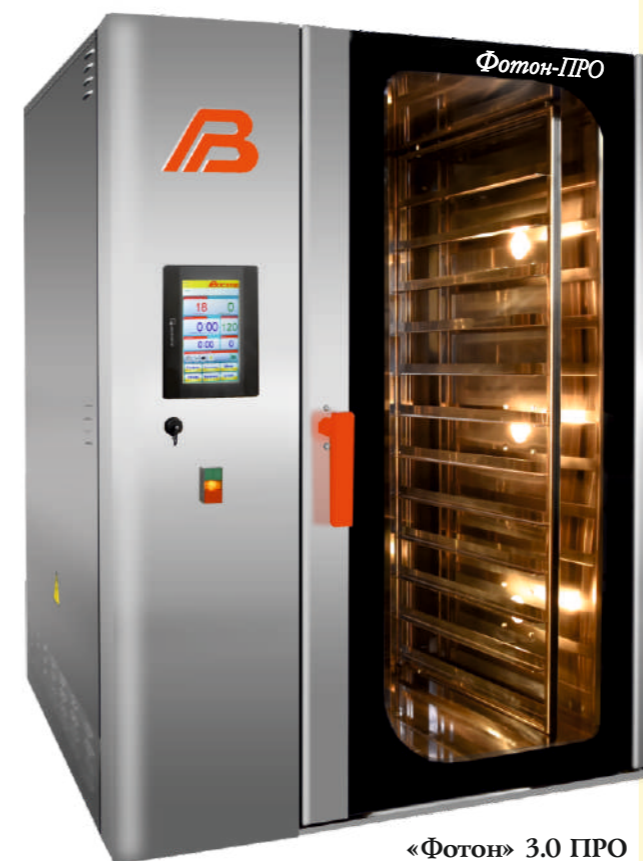
«Фотон» 3.0 ПРО

В зависимости от производительности и выпекаемой продукции предлагаем различные варианты комплектации.