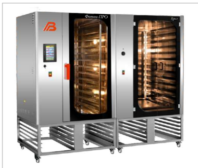
Печь «Фотон» 3.0 ПРО расстойный шкаф «Бриз» 3.0 на подставках