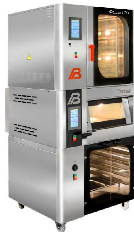
«Фотон» 1.5 ПРО, «Пассат» 048, «Бриз» 1.5