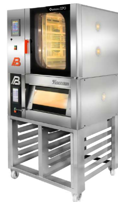
«Фотон» 1.5 ПРО, «Пассат» 048, подставка