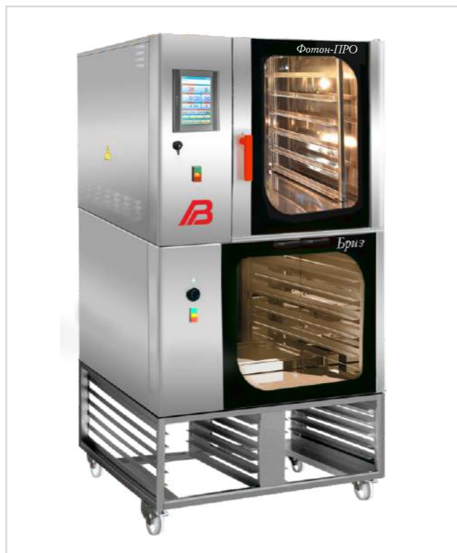
Печь «Фотон» 1.5 ПРО расстойный шкаф «Бриз» 1.5 на подставке