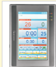
Автоматическая система управления