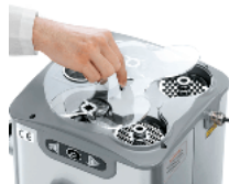
Compartment for knives and plates