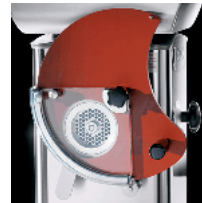
Optional patty former