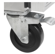
Прочные колеса по заказу