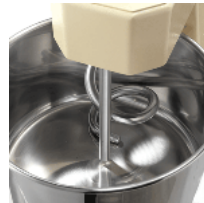
S/S bowl and shaft