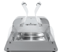
Doors in transparent collision-proof plexi