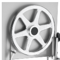
Hermetic upper pulley