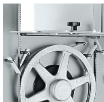
Alimentary plastic blade scraper in quick to insert. Watertight black plastic flange to protect the