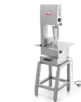
SO 2020 Floor standing