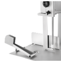
Alimentary plastic blade scraper in quick to insert. Hermetic upper pulley Watertight black plastic flange to protect the